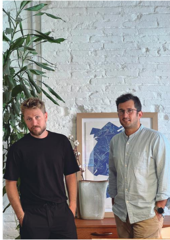
Foto: Pablo Poblet y Carlos Carrillo. Tres Cinco Uno Creative Studio. Foto Natalia Calpe